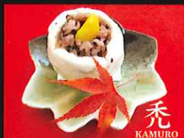
比叡山名物赤飯まんじゅう